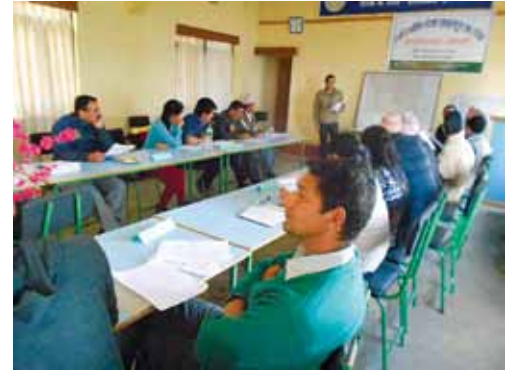
गोष्ठीमा समूह छलफलको सारांश प्रस्तुत गर्दै सहभागी