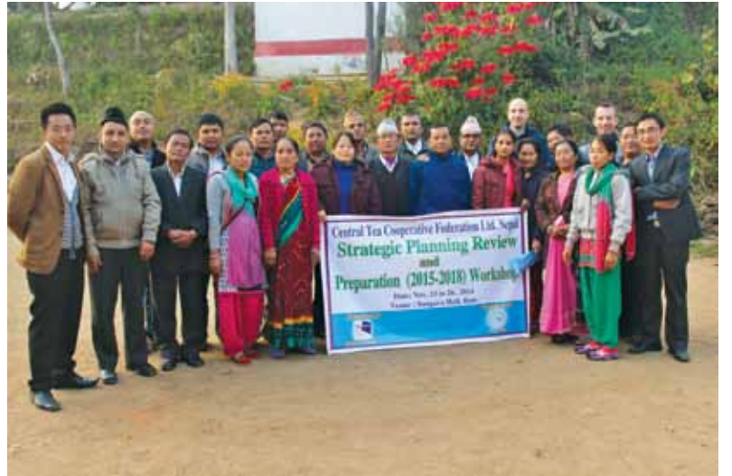
संघको ४ वर्षे रणनीतिक योजना तर्जुमा कार्यशालामा सहभागीहरू

► व्यवसायिक, सवल तथा सक्षम सदस्य सहकारीहरू बनाउने