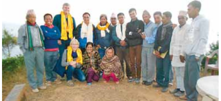
एग्रीटेरा नेदरलेण्डको भ्रमण टोली राम्चे चिया उत्पादक सहकारी संस्था धनकुटामा