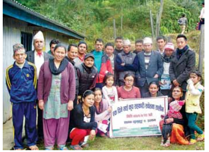
माईकुप सहकारी सचेतना तालिम कार्यक्रममा सहभागीहरू

केन्द्रीय चिया सहकारी संघ लि. नेपालको सहयोगमा विभिन्न जिल्लाका १४ वटा चिया सहकारीहरूमा एक दिने सहकारी माईकुप सचेतना तालिम सम्पन्न भएको छ । उक्त एक दिने सचेतना कार्यक्रम सहकारीहरूको आयोजनामा ईलाम जिल्लाका ४, धनकुटा जिल्लाका २, तेह्रथुम जिल्लाका ३, पाँचथर जिल्लाका ३, ललितपुर जिल्लाका १ तथा भोजपुर जिल्लाका १ सहकारीमा सञ्चालन गरिएको थियो । उक्त तालिममा ४०७ जना सहकारीका सदस्यहरूको सहभागिता थियो । यस तालिममा सहकारीका सिद्धान्त र यसको व्यावहारिक प्रयोग तथा सहकारीको चुनौती र सदस्यहरूको प्रतिवद्धता जस्ता विषयवस्तुहरू समावेश गरिएको थियो । उक्त तालिमलाई जिल्लागत रूपमा सहकारी माईकुप प्रशिक्षण प्रशिक्षार्थी तालिम लिएका सहकारीकर्मीहरूले सहजिकरण गरेका थिए ।