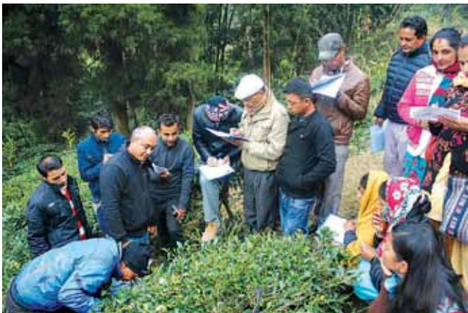
चिया खेती प्राविधिक तालिममा सहभागीहरू प्रयोगात्मक अभ्यास गर्दै