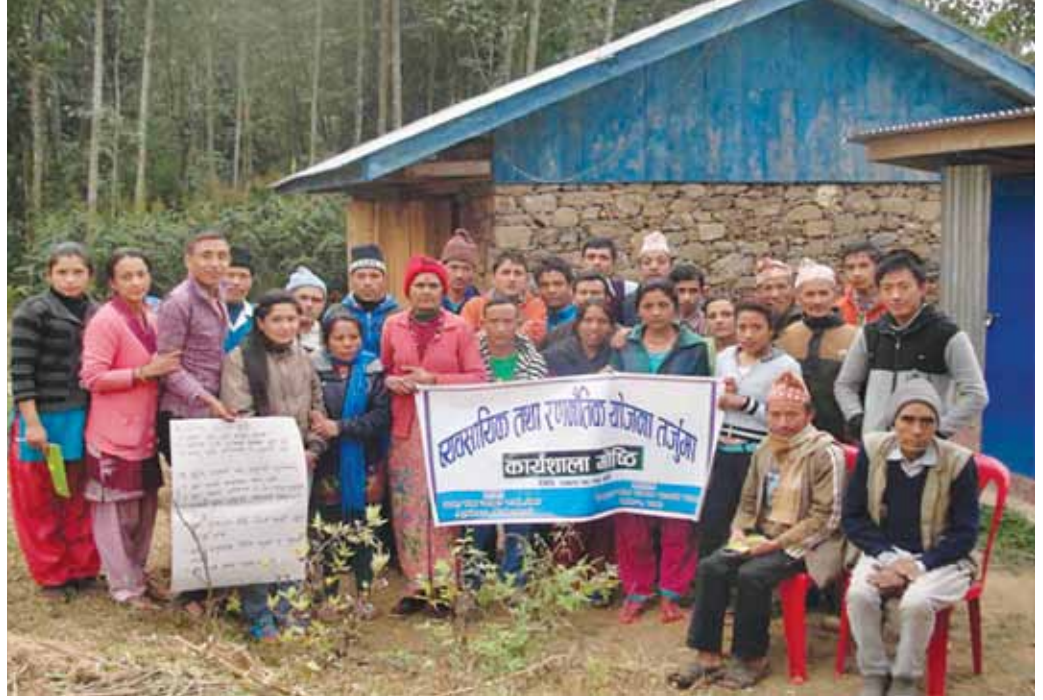
बोधदुङ्गा चिया उत्पादक सहकारी संस्थाका व्यवसायिक योजना कार्यशाला गोष्ठीमा सहभागिहरू

केन्द्रीय चिया सहकारी संघ लि. नेपालले इलाम, पाँचथर, भूपा, भोजपुर, ललितपुर, भोजपुर र संखुवासभा सहित ७ वटा जिल्लाको ९ वटा चिया सहकारीहरूको व्यवसायिक कार्ययोजना तर्जुमा कार्यशाला गोष्ठी संचालन गर्नका सहयोग गरी सहकारीहरूको ३ वर्षको व्यवसायिक कार्ययोजना बनाइएको छ । यस गोष्ठीमा प्रत्येक सहकारीहरूको संचालकहरू, लेखा समिति, सदस्य तथा कर्मचारीहरूको उपस्थितिमा संस्थाको अवस्था विश्लेषण, सरोकारवाला विश्लेषण, वित्तिय अवस्थाको विश्लेषण सहित भावी तीन वर्षमा गरिने क्रियाकलापहरूको प्राथमिकरण गरी योजना तर्जुमा गरिएको थियो । सहकारीहरूले आगामी दिनमा सदस्यता वृद्धी, शेयर तथा वचत वृद्धी, नर्सरी तथा रोपण विस्तार, सानो प्रशोधन उद्योग संचालन, अर्गानिक चिया खेती उत्पादन, भर्मी कम्पोष्ट उत्पादन, सहकारी शिक्षा, प्राविधिक तालिम लगायतको क्रियाकलापहरूलाई योजनामा समावेश गरेको छ । यस योजनाले आगामी दिनमा गर्ने कार्यहरूको दिशा निर्देश गरी बाटो देखाउने र